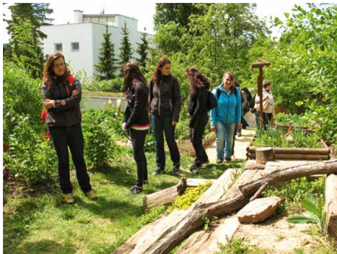
Vodní prvek v bylinkovém záhonu (Lipka – pracoviště Lipová).

A jelikož se téma přírodních terapeutických zahrad dotýká i oblasti ekologické, najdete podporu zahradní terapie výslovně deklarovanou i ve Státním programu environmentálního vzdělávání, výchovy a osvěty a environmentálního poradenství 2016–2025. Je ukotvena ve Strategické oblasti 2: Kvalita, diverzita a inovace v EVVO a EP, cíli 2.6 Nové směry. A dále ve Strategické oblasti 5: Vzdělávací cíle a relevantní témata EVVO a EP, cíli 5.2 Příroda, opatření 5.2.7.