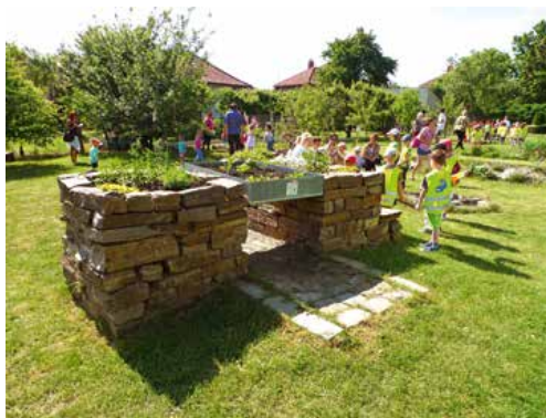
Různé typy pultových záhonů pro vozíčkáře v DSPS Kamenná a v ZŠ Velká Bíteš.