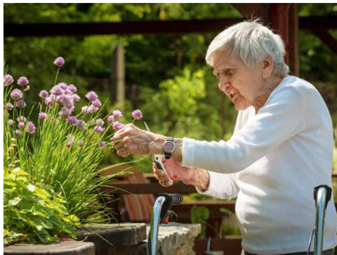
Voňavé byliny jsou na vyvýšeném záhonu lépe přístupné (DSPS Kamenná).