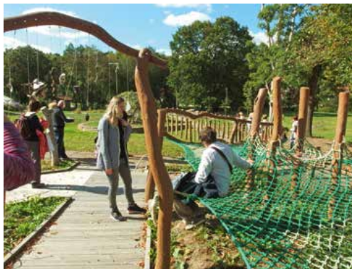
Houpání v síti stimuluje mozek napodobením stavu beztíže.