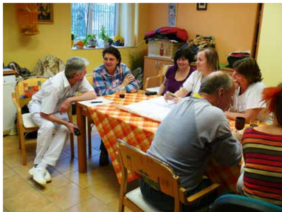
Během komunitního setkání získáte přehled o tom, jak by vaše „ideální“ zahrada měla vypadat.

V širším zaměstnaneckém kruhu by se také měl řešit reálný časový harmonogram i možnosti svépomocného zajištění části zahradních úprav.