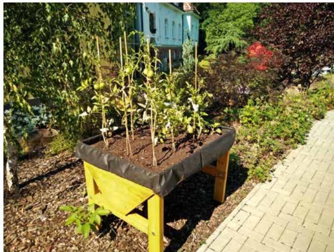
Stolový záhon v Domově pokojného stáří Kamenná je vhodný i pro vozíčkáře.