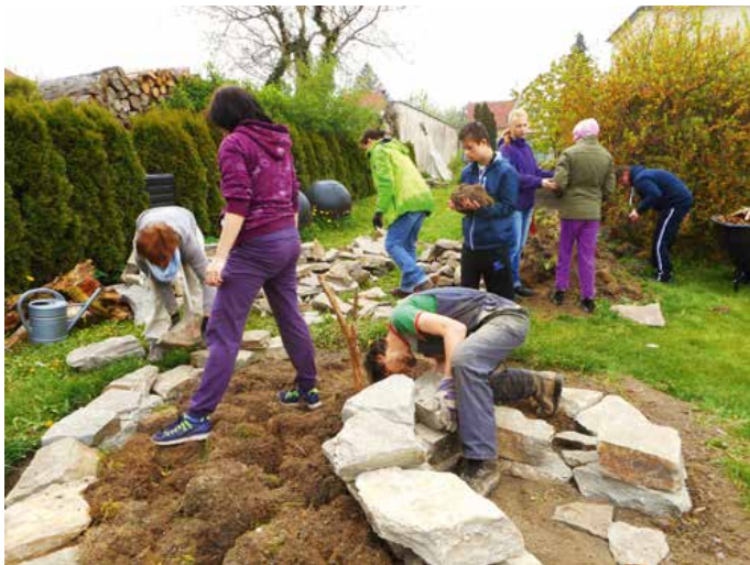
Na vybudování tzv. afrického záhonu v areálu speciální ZŠ Velká Bíteš se podíleli žáci i pedagogové.

Nyní už je čas převést myšlenky z plánů do praxe. Část prací budou zajišťovat odborné řemeslnické firmy, nicméně při tvorbě terapeutických zahrad je velký potenciál pro svépomocné aktivity. Zapojení rodičů dětí, příbuzných klientů, dobrovolníků anebo klientů samotných nemá význam jen s ohledem na finanční úspory. Neméně důležitý je vztah k zahradě, který takto už od začátku pomáháme budovat u klientů i jejich blízkých. Zvyšujeme tak pravděpodobnost, že budou do zahrady rádi chodit, setkávat se, s chutí o zahradu pečovat, pracovat i radovat se.