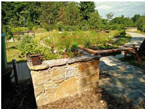
Pultový záhon pro vozíčkáře.

Nejprve je třeba si ujasnit, s kým budete do zahrady chodit a jak chcete zahradní terapii právě ve vašem zařízení zaměřit. Kdo bude zahradu využívat a jak se zahrada může stát součástí terapie, kterou právě vaši klienti potřebují? Na tuto otázku nemůže odpovědět žádný odborník zvenčí. Odpověď musí vzejít z dobré znalosti každého jednotlivého zařízení. A pak poslouží jako vstupní zadání pro odborníky, jejichž účast na celém postupu budování zahrady je také nezastupitelná.