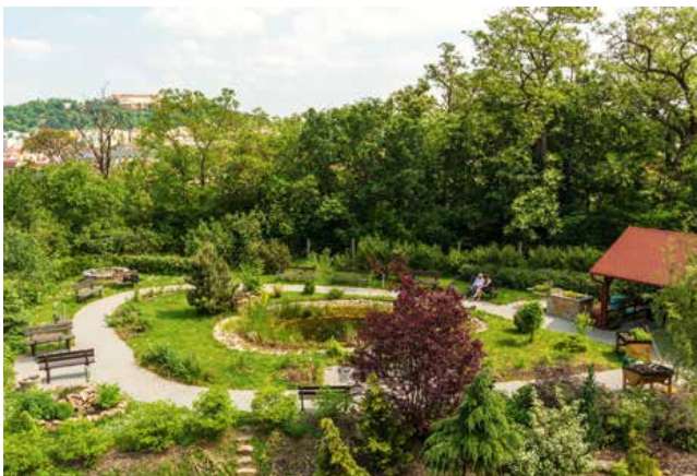
Takto naplánovali a také uskutečnili zahradu v Domově pokojného stáří Kamenná.