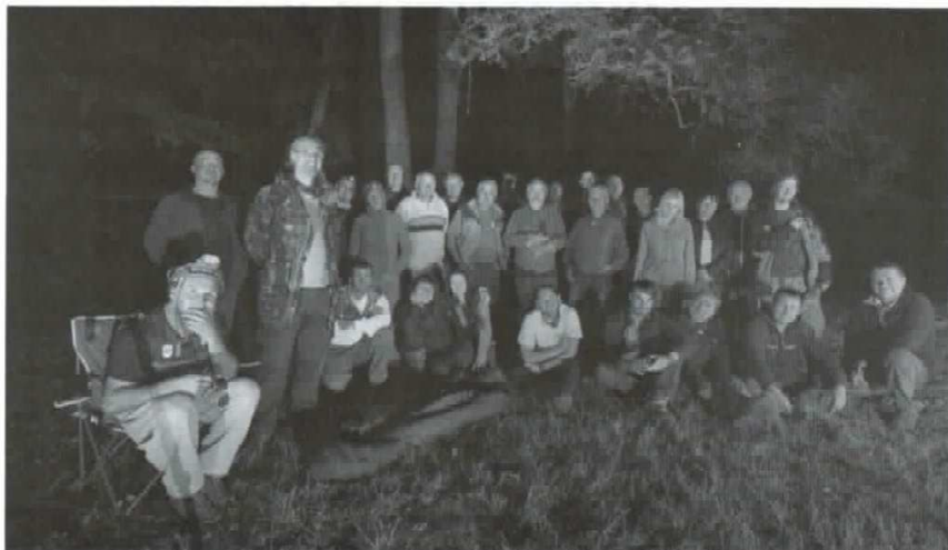
Večerné posedenie.

Návšteva Čachtickej jaskyne bola pre nás hlavným podujatím roka. Od druhej jaskyne v programe návštevy slovenských priateľov – Beckovskej, objavenej roku 1983 – nás delilo viac než 20 km. Museli sme sa presunúť do pohoria Považský Inovec, do okolia obce Beckov. Tunajší hrad z prelomu 12. a 13. storočia, týčiaci sa do neba na 60 m vysokom skalnom výstupku na mieste dávnej uhorskej hranice, je dnes národnou kultúrnou pamiatkou. Aj keď Beckovská jaskyňa neohuruje rozmermi – je 150 m dlhá a 70 m hlboká, jej nepopierateľným prínosom je úžasná kvapľová výzdoba či bohatstvo kryštálov s peknou štruktúrou. A tiež neodmysliteľné rebríky.