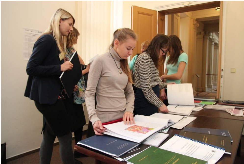
Zájemci prohlížejí soutěžní práce vystavené na Krajském úřadě Jihomoravského kraje.