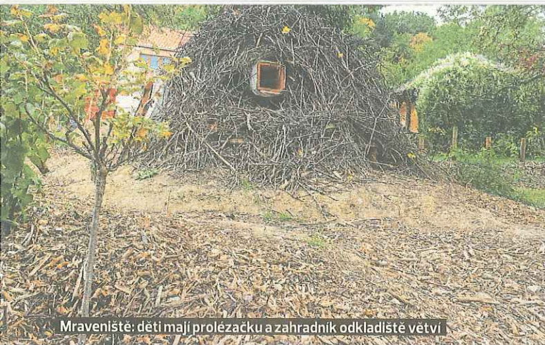
Mraveniště: děti mají prolézačku a zahradník odkládá větvi